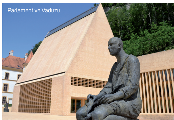
Parlament ve Vaduzu

Dotýkáme se kapitoly, která je fascinující: v Lichtenštejnsku se každoročně vydává na výzkum a rozvoj 8,4 % HDP. Pro srovnání, v USA je to 2,7 %, v Německu 2,9 %, ve Finsku 3,2 %, v Japonsku 3,6 % a třeba v Iz-