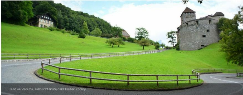
Hrad ve Vaduzu, sídlo Lichtenštejnské knížecí rodiny.